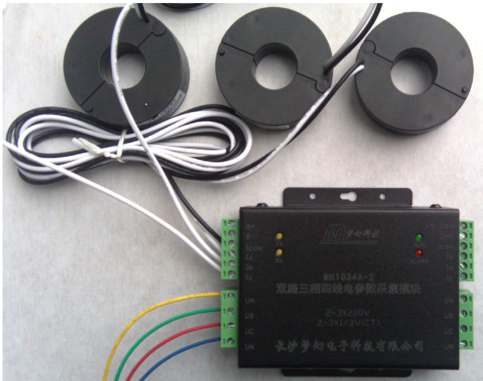
钳型互感器外接图